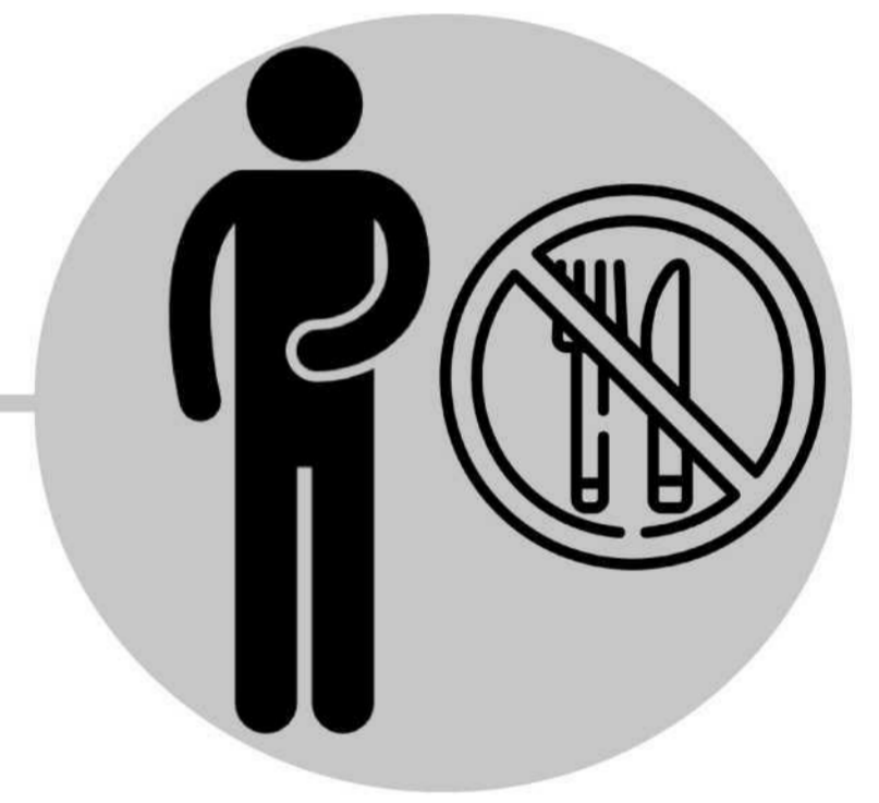
Amateedka oo xumaada

Qandho, dareemid daal, amateedka oo xumaada, iyo madax xanuun ayaa soo muuqan kara maalin ilaa laba maalmood kahor intaan firiiricu kobcin. Firiirica ayaa laga yaabaa inay marka hore kasoo muuqdaan wejiga, laabta, iyo dhabarka kadibna ku fidaan jirka intiisa kale. Tan waxaa ku jira gudaha afka, baalasha indhaha, ama xubnaha taranka. Firiirica ayaa isu beddela cuncun, fin-dheecaan dheecaan ka buuxo kaas oo qub-dhaca toddobaad gudihi. Calaamadaha badanaa waxay soo baxaan 14 ilaa 16 maalmood cudurka kadib, laakiin waxay u dhaxayn karaan 10 ilaa 21 maalmood.