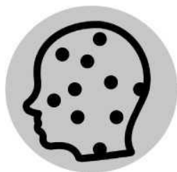
Erupção da pele