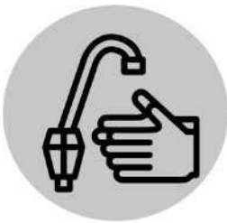
Se laver souvent les mains