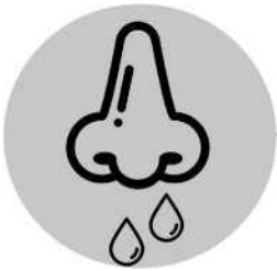
Nez qui coule