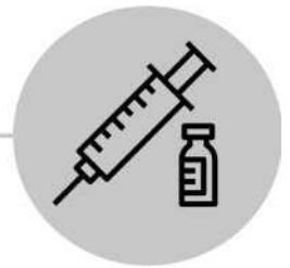
Se faire vacciner (DTaP pour les enfants, Tdap pour les adultes)