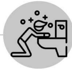
Vomissements ou haut-le-cœur après une toux