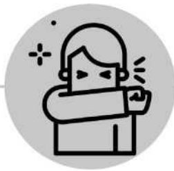
Couvrir la toux avec la manche