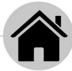
Rester à la maison quand on est malade