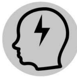
Dor de cabeça