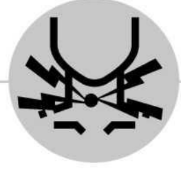
Dor de garganta